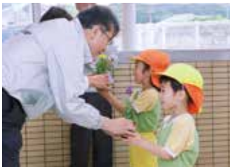
花苗の贈呈(すばる幼稚園)