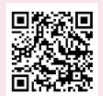
石川県トキ観察 マナー動画