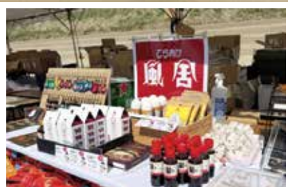
ゴール地点に志賀町ブースを出展▶