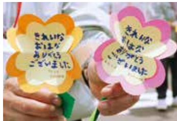
園児が委員へ贈ったお礼のカード