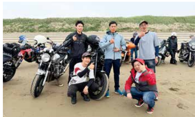
▲SSTRで無事ゴールを果たした稲岡町長(中央)と同行した町職員