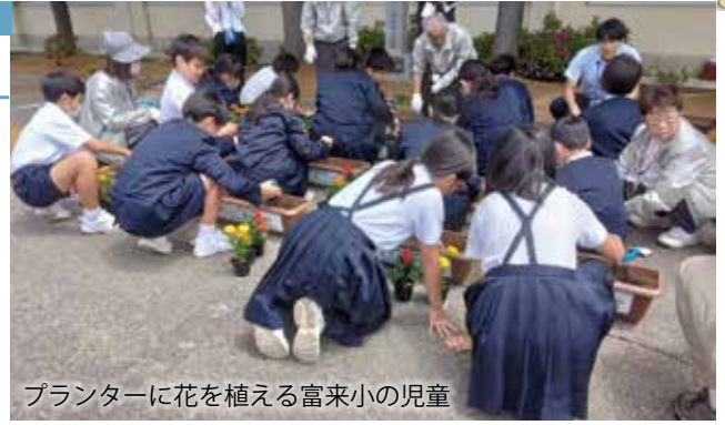
プランターに花を植える富来小の児童

また、6月4日(木)、すばる幼稚園の年長児43人が同協議会志賀部会の委員と「なかよし花壇」づくりに取り組みました。人権擁護委員による紙芝居を聞いて人を思いやる心の大切さを学んだ後、花苗の贈呈を受けました。一人一つずつ花壇に花苗を植え、協力して色鮮やかな「なかよし花壇」を完成させました。園児たちは花の成長を楽しみにしながら、水やりなどのお世話を続けていきます。