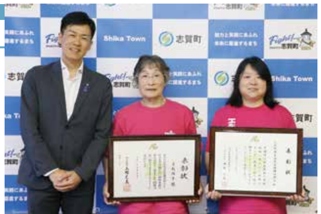
(左から)稲岡町長、屋敷さん、西浦さん

屋敷さんは「受賞を励みに、これからも活動していきたい」、西浦さんは「一生懸命頑張ってきたことを認めてもらえてうれしい」と喜びを語りました。