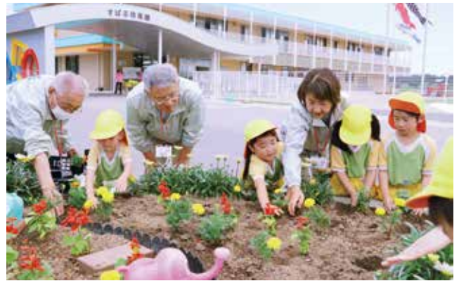
委員と共に花壇に花を植えるすばる幼稚園の園児