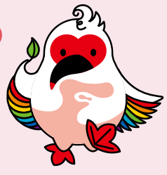
トキPRキャラクター のとつきー