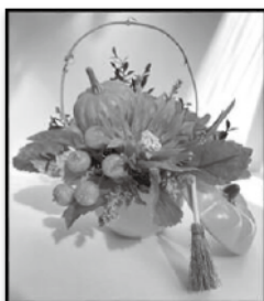
※写真はイメージです。サイズ:高さ約20cm×幅約20cm