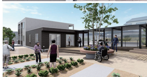
コミュニティー促進を図る共同菜園