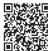
▲ 第3次志賀町 総合計画 ID 1166

※総合計画の概要版を作成しました。町内全世帯へ配布しますので、ぜひご一読ください。また、本編および概要版は町ホームページにも掲載していますので、併せてご活用ください。