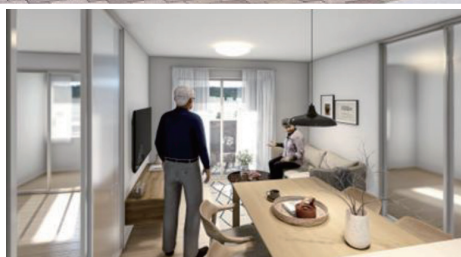
南向きの解放感があるLDK