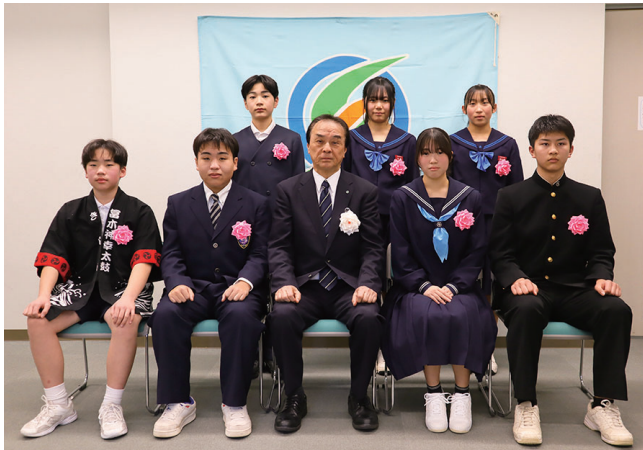
意見発表した小中高校生の皆さん