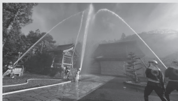
昨年1月の西来寺(末吉)での訓練

【日時】 8:00～ 赤住八幡神社(赤住) 1月25日(日) 9:00～ 金刀比羅神社(福浦)