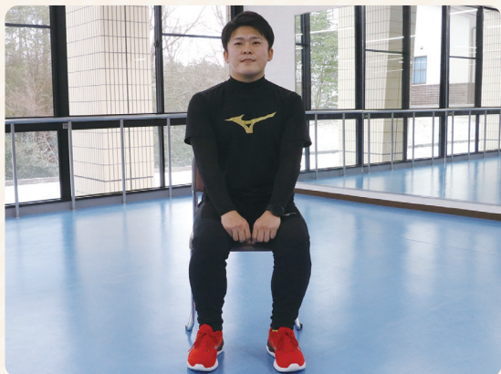
①内ももの間に両手のこぶしを挟む。