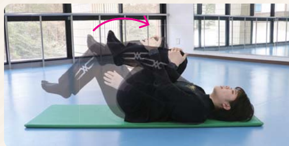
② 両膝を両手でつかんで胸に引き寄せる。