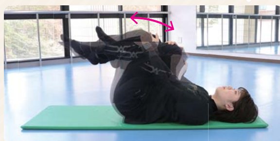
③ 膝を交互に揺らし、少しずつ大きく揺らす。