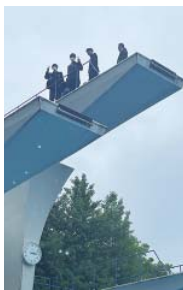
飛び込みプールのジャンプ台

平成27年に、町と大学が「体育・スポーツ振興に関する協定」を結んだことから修学旅行での大学訪問が始まりました。今年は4年ぶりの訪問で、体操・野球・水泳飛込などの施設のほか、学内の接骨院・整骨院などを見学しました。