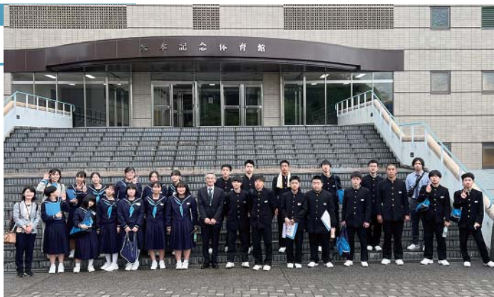
日本体育大学の講堂前で記念撮影