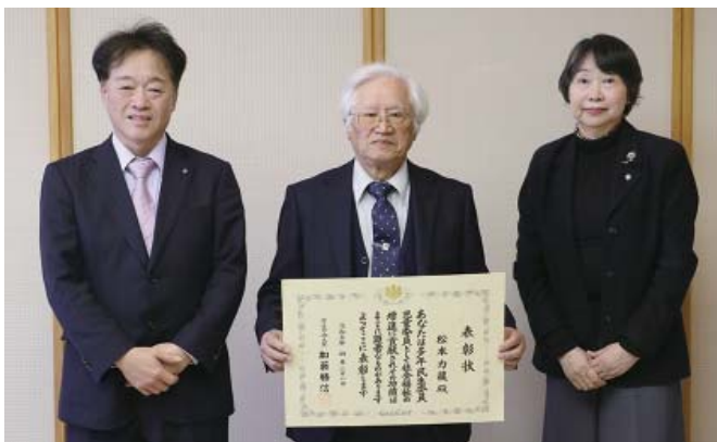
(左から)小泉町長、松本さん、松村会長