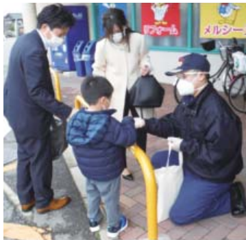
昨年の街頭防火宣伝の様子

まだまだ寒さが残り、家庭や職場でストーブなどの暖房器具を使用する機会が多く、また空気が乾燥し火が燃え移りやすい時期です。昨年、羽咋郡市管内では、建物火災4件、林野火災1件、車両火災2件、その他の火災7件でした。火災のほとんどは、ちょっとした不注意から発生します。火の取り扱いや火の始末について、今一度考えましょう。また、コロナ禍が続く、おうち時間が増えている中、ガスや電気配線など、住宅火災の原因となる部分を点検しましょう。