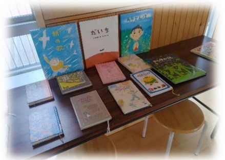
↑本コーナーの写真

誰でも読める本コーナーを設置しました。元気が出る詩、心が温まる詩や、ときにちょっと複雑な気持ちになるような考えさせられる詩などの詩集が置いてあって、随時更新する予定です。休み時間、通りがかりに手に取って誰かの心に届けば嬉しいです。11月には教育ウィークで学校公開があります。志賀小学校においでの際には、ぜひご覧ください。