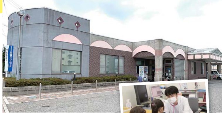
志賀クリニック ☎ 32-5307