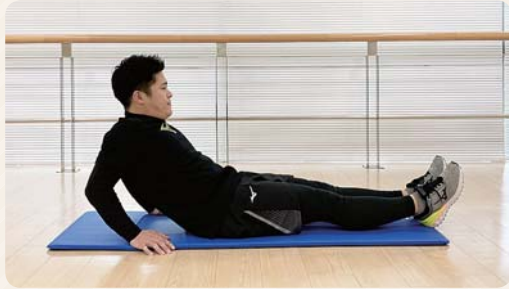
① 両手をついて少し背中を床から離す。