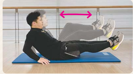
② 両膝を胸の方に引き寄せていく。息を吐きながら引き寄せ、吸いながら元の位置に戻す。