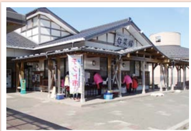
直売所での販売「テント市」