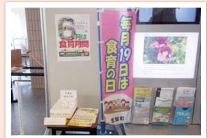
食育月間・食育の日の普及啓発