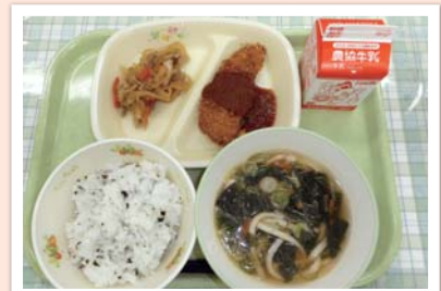
郷土料理を取り入れた給食の提供