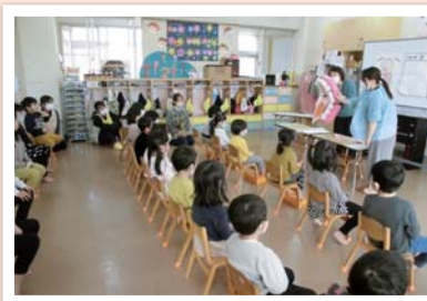
保育園での栄養教室