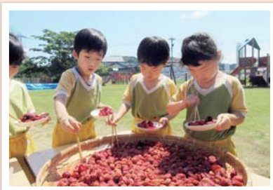
幼稚園での梅干し作り体験