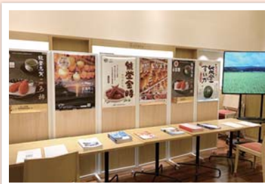
イベントでの地場産物のPR