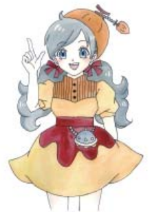
羽咋郡市広域圏 事務組合消防本部 火災予防 PR キャラクター かさいしょうか