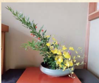
藤井 弘子 【嵯峨流】