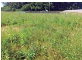
遊休農地のイメージ

利用意向調査の回答後6カ月経過後に、その意向どおりに農地が利用されているか、農業委員会が現地確認を行う予定です。