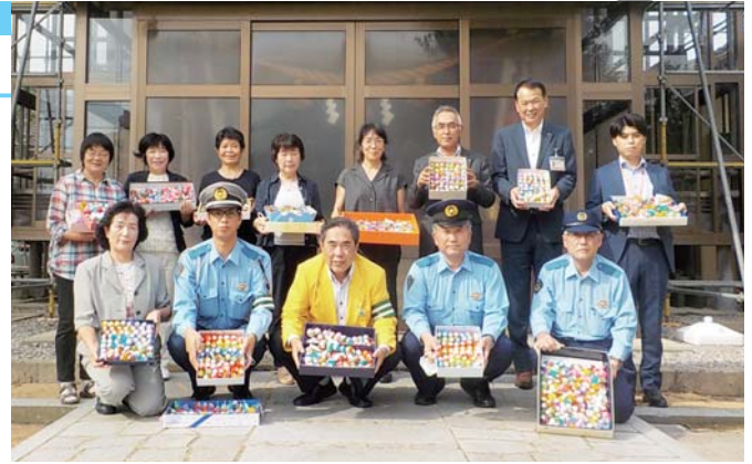
祈願祭に出席した皆さん