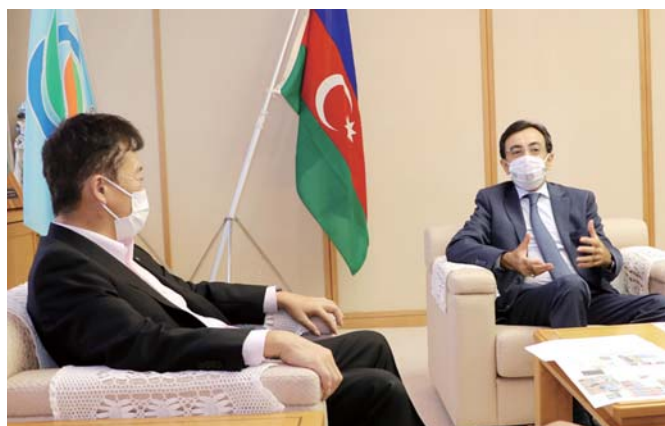
今後も交流をと話す駐日大使(右)

9月17日(金)、パラリンピック大会事前合宿のお礼に とアゼルバイジャンのギュルセル・イスマイルザーデ特 命全権大使と、ロヴシャン・ジャファロフ一等書記官が 志賀町役場を訪れました。