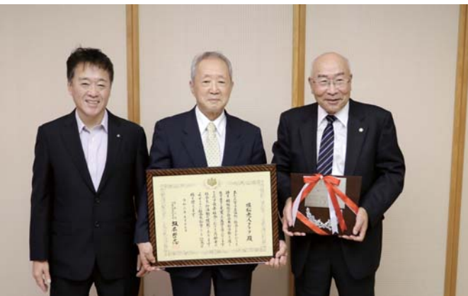
左から小泉町長、谷崎会長、干場連合会会長