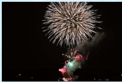
「志賀卒業記念リレー花火」