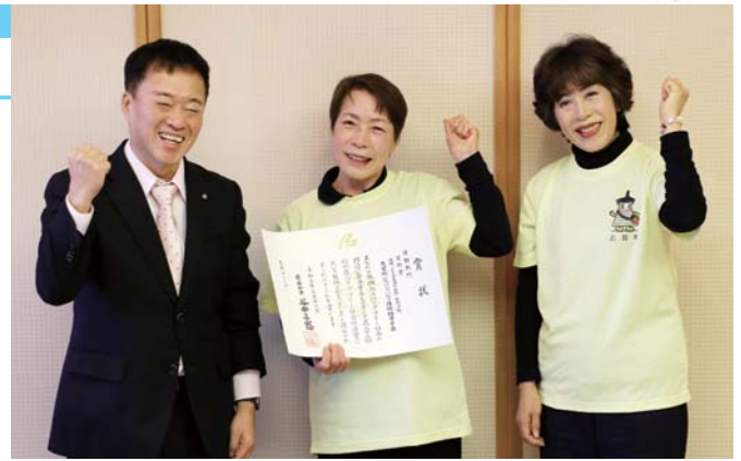
村山会長(中央)と安田副会長(右)

小泉町長にも、座ってできる体操を指導し「いつでも、どこでも、ひとりでもできる簡単な体操が多いです。みなさんにもっと知ってもらえるよう、引き続き活動していきます」と話しました。