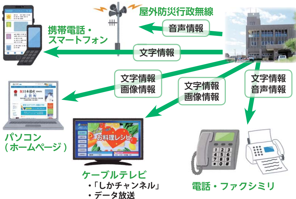
図 情報推進課 ☎ 32-9261