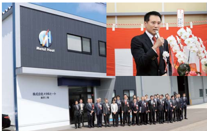
能登工場前に並ぶ開所式出席者 あいさつをする原代表取締役(上)