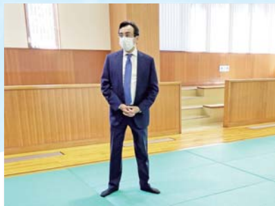
合宿施設を見学するギョルセル駐日大使