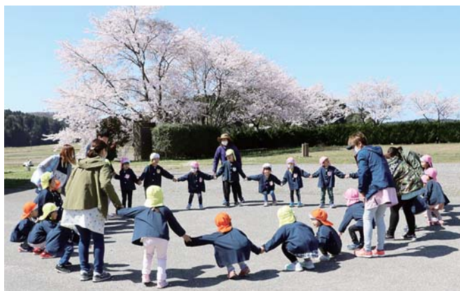
お花見散歩に参加した園児たち