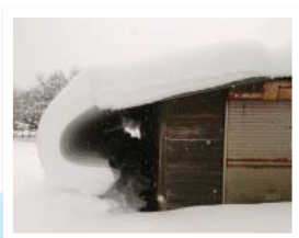
調査期間: 令和2年12月4日 ~令和3年1月15日 ◇広報しか掲載号と掲載頁

新年互礼会などがウイルス感染症防止のため中止 7日から8日にかけて気象庁が2019年運用後初の「顕著な大雪に関する気象情報」を発表 7日から11日にかけて大雪積雪に関わる緊急出動に備え出初式が中止