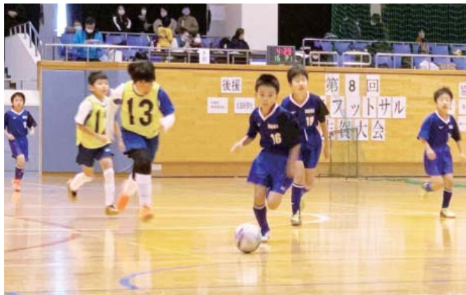
元気にボールを追う選手