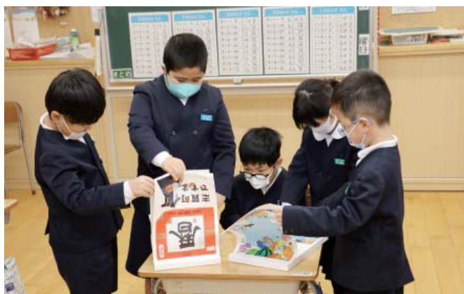
届いたカレンダーを見る志賀小学校の児童