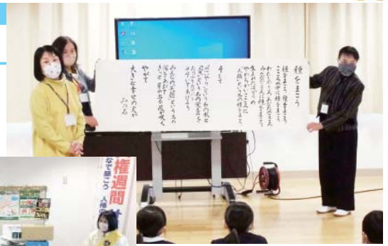
富来小学校での人権教室(上) 街頭での啓発活動(左)

この活動は人権について知ってもらい人権意識を高めることを目的に毎年実施しています。