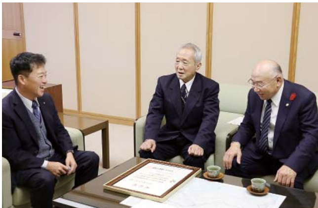
受賞を報告する谷崎会長(中央)