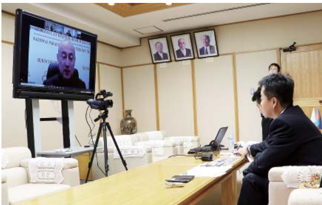
イルガル会長(画面)と小泉町長(右)