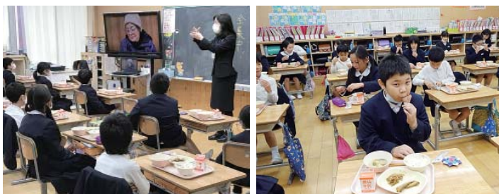
ころ柿の出来るまでを学習(左) 給食でころ柿を食べる児童(右) …