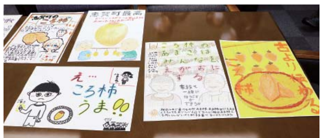
志賀小学生児童が描いた「ころ柿PRポスター」