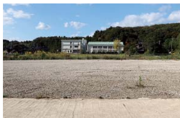
解体、整地された旧堀松保育園跡地

公共施設等総合管理計画に基づき、旧堀松保育園の解体を行いました。また、今後の公共施設などの整備や解体撤去の資金に充てるため、公共施設等整備基金に1億2千万円を積立てしました。