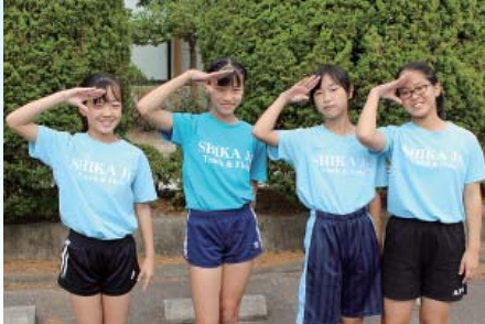
志賀 Jr 陸上 女子A