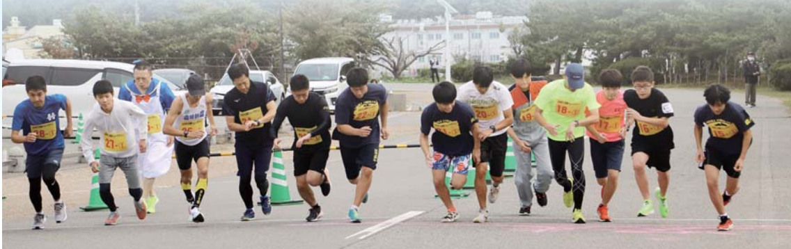
2.4kmコースのスタート