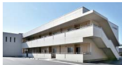
完成したファミリー棟