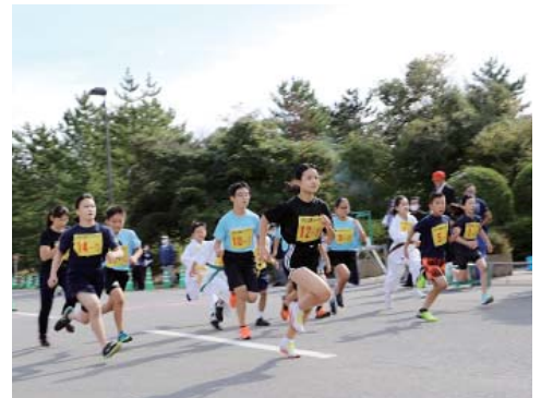
1.9kmコースのスタート