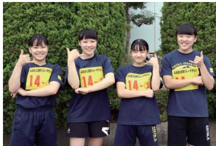
志賀町レスリング女子