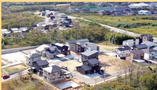
住宅建設が進むみらいとうぶ

魅力ある子育て・教育環境や奨励金制度を広くPRしながら、みらいとうぶの分譲区画の早期完売に努め、町外からの移住と若者の定住を促進しました。