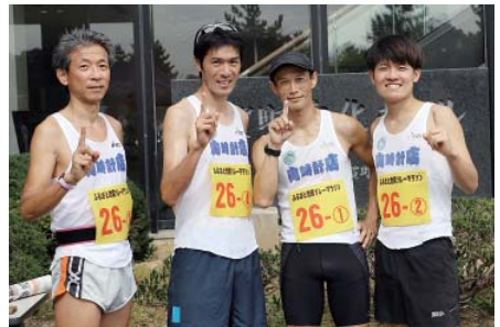
ヤマ時計店と富来 a c