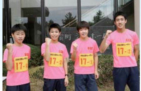
E C C 3連覇ガチ勢