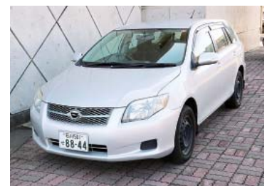
カローラフィールダー