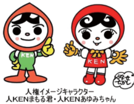
人権イメージキャラクター 人KENまもる君・人KENあゆみちゃん