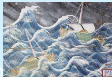
紙本 難破船之図額