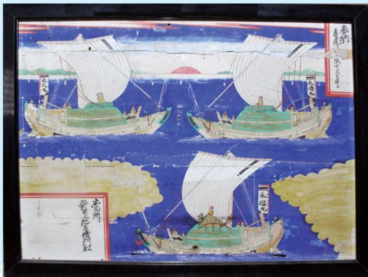
紙本 永徳丸・永久丸・永福丸額