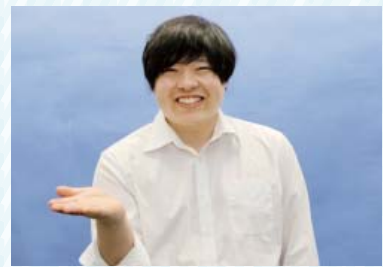
たずねる表情で、手のひらを上に 向けて相手の方へ出す