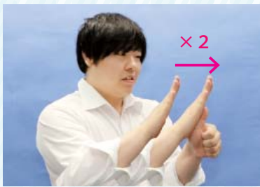
左手の親指を立て、右手のひらで 2回トントンと軽くたたく