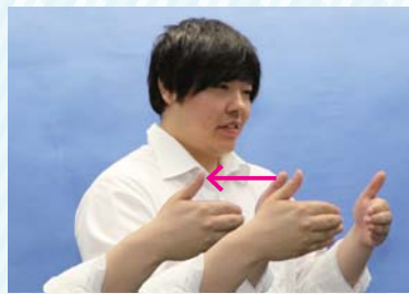
両手の4指を曲げて指先を向かい 合わせ、自分側に引き寄せる