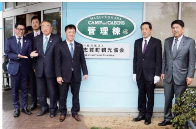
左から寺岡専務理事、山口副理事長、石川県議会議員、小泉町長、上江理事長、寺井町議会議長

今後は、日本版DMO（観光地域づくり推進法人）の本登録を目指します。地域の観光戦略のまとめ役として期待されます。