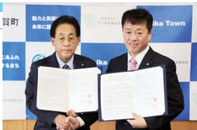
毎田協会会長(左)と小泉町長

この協定は、志賀町で地震や集中豪雨による河川の氾濫などの大規模な災害が発生した場合、相互に協力して災害対応に取り組み、町民生活の早期安定を図ることを目的としています。今後、大規模災害が発生した際には、災害廃棄物の初動調査や処理に関して、より迅速な対応が可能となります。