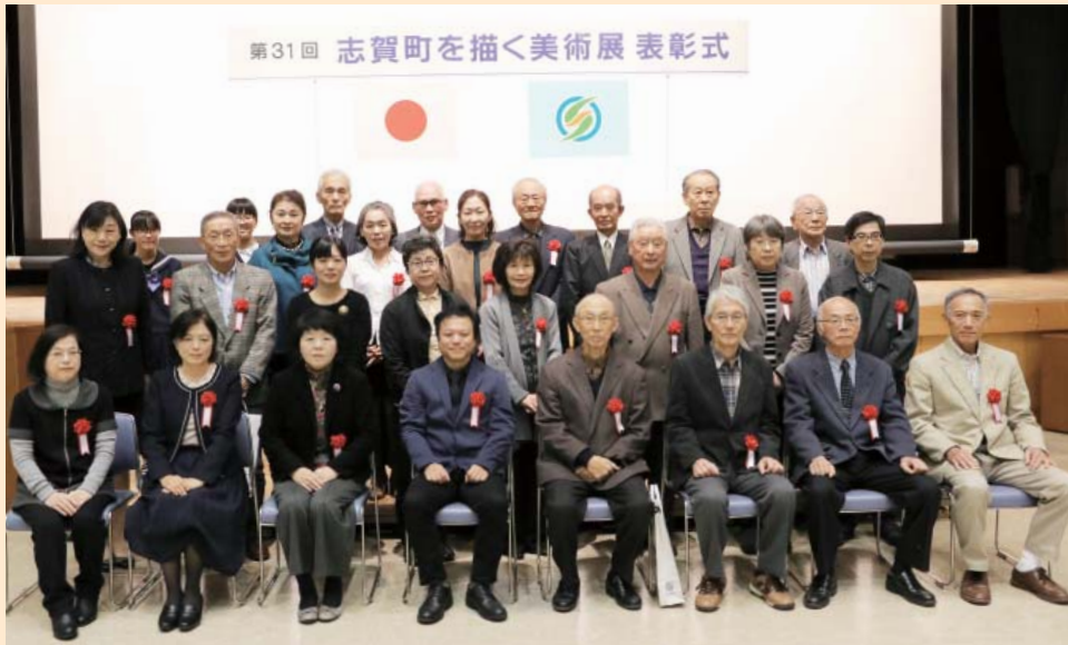
第31回 志賀町を描く美術展 表彰式

今年、県内外から148点の作品が展覧され、11月16日(土)、志賀町を描く美術展実行委員会が、入賞者31名を表彰しました。大賞受賞者をはじめ、受賞作品の一部を紹介します。