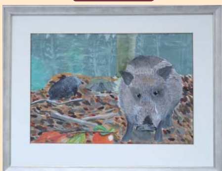
里山の秋 大岡 未来 (志賀町) 洋画