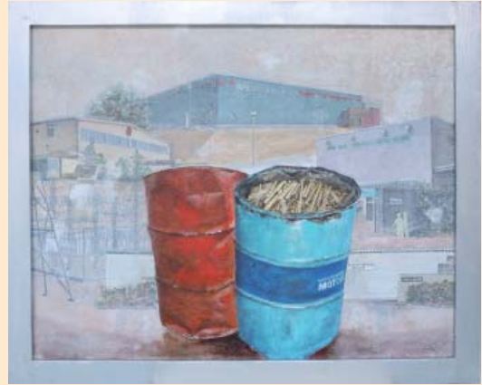
黄金 (能登中核工業団地) 岡野三千治 (加賀市) 洋画