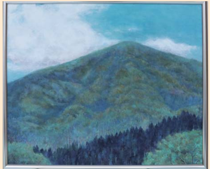
高爪山 平 和美 (七尾市) 日本画