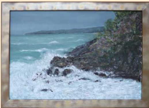
如月の波濤 坂下 隆光 (志賀町) 洋画