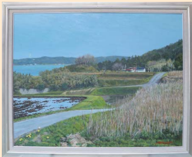
拝啓 陽春の候 米沢 善雄 (志賀町) 洋画