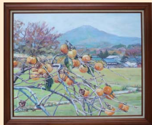
柿と高爪山 谷 和弘 (能登町) 洋画