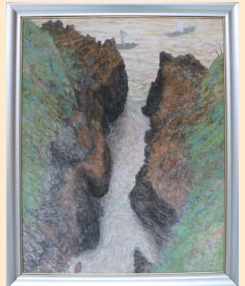
義経慕情 水口 志華子 (金沢市) 日本画