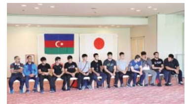
アゼルバイジャンチーム 歓迎レセプション