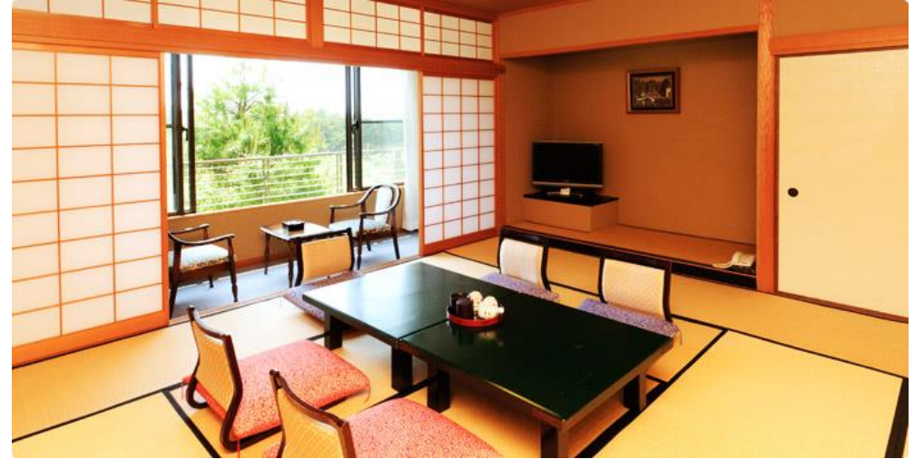
いこいの村能登半島