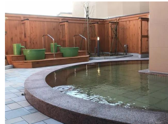
とぎ温泉 ますほの湯