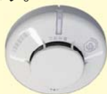
住宅用火災警報器