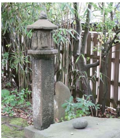
ろくじぞうせきとう 六地藏石幢（町指定文化財）

庭園には、書院に面した前庭 ぜんてい と、奥座敷に面した後庭 こうてい があります。前庭は、矩形に地割され、心字の池と石橋の後方に築山を造り、中心部に枯滝の石組みが見事に配されています。