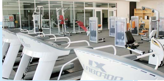
新しくなったフィットネスルーム