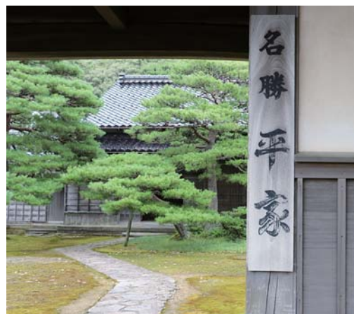
正門から見た平家