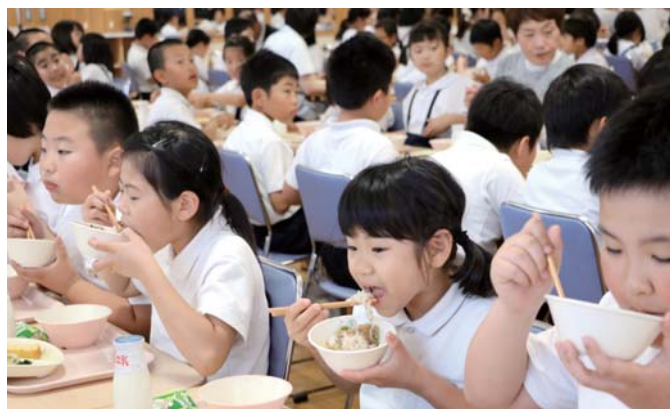
一斉に牛丼を食べる児童たち

富来小学校では、多くの児童が「いただきます」の号令とともに牛丼をかき込むように食べ、地元で育った恵みに頬を緩めました。