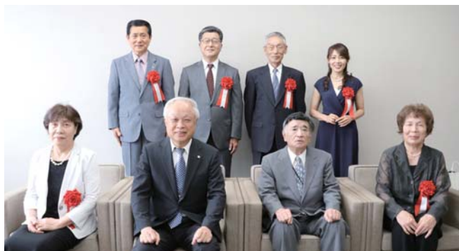
【志賀町文化協会表彰者】㊦：功労賞 ㊧：奨励賞 (前列左から) (後列左から)

また、今年は、特別出演として、オーケストラ・アンサンブル金沢のメンバーによる弦楽アンサンブルが行われました。観客は、ヴァイオリンやヴィオラなどの弦楽器が奏でる美しい旋律やメゾ・ソプラノの歌声に聞き入りました。