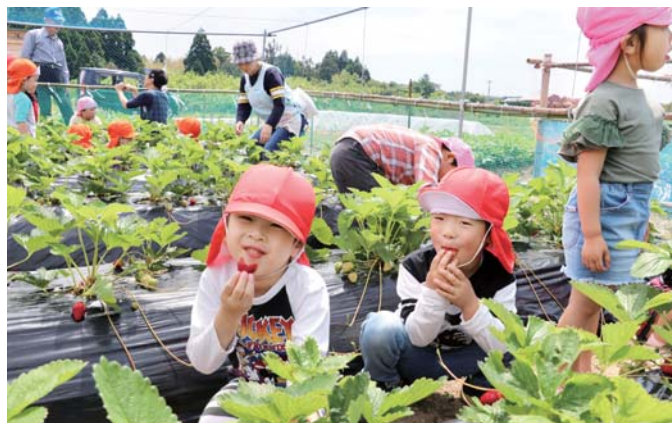
もぎたてイチゴをほおばりにっこり笑顔の園児