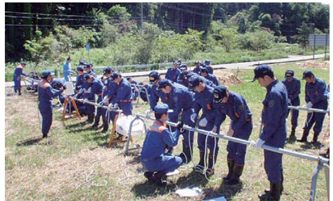
ロープの結び方を学ぶ消防団員

この日は、災害時に使うロープの結び方、土のうの作り方・積み方をなどを実技で学びました。