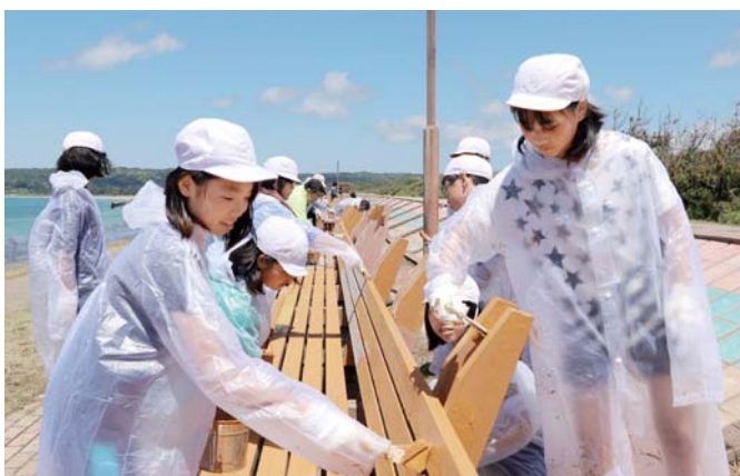
ペンキを塗る富来小学校の児童たち

富来小中学校の児童・生徒や、すみれ作業所の職員・利用者などボランティアの人々120人が参加しました。参加者は、はけで黄土色のペンキをぬり、全長460.9mのベンチは、キレイに生まれ変わりました。