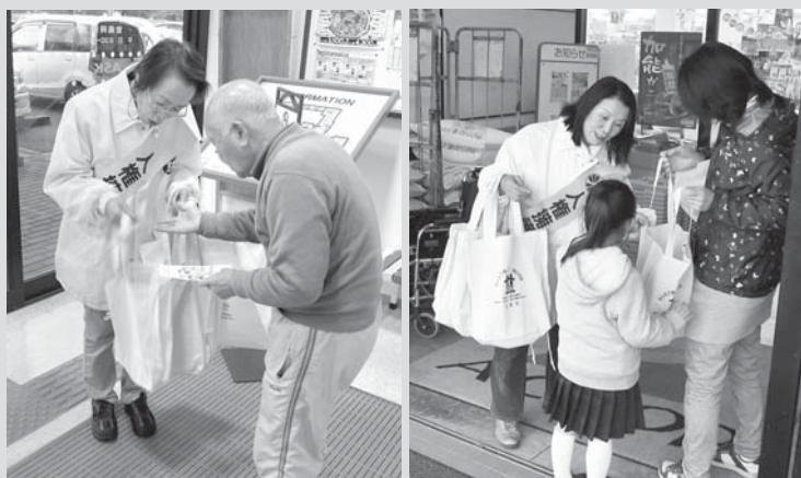
街頭活動を行う人権擁護委員

街頭活動は、人権について多くの人に知ってもらおうと毎年実施しているもので、志賀地域2カ所、富来地域2カ所の計4カ所で行われ、啓発チラシや標語入り啓発物資を配布し、人権の大切さを呼びかけました。