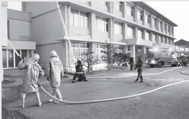
火災防ぎょ訓練で放水する様子(旧志加浦小学校にて)