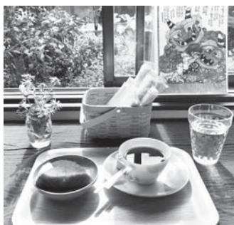
お手製チーズケーキとコーヒー

ランチに添えられた「ありがとう」の手書きメッセージや机に飾られた野花など、スタッフの細かな心遣いにとっても心が温まりました。 支援スタッフは「これからも地域に根ざした活動をしていきたい」と意欲的で、今後、月一回開催予定です。 皆さんも美味しい食事と素敵なウエイトレスがいる「鹿頭カフェ 夢生民」に一度足を運んでみませんか？