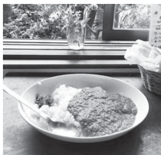
子どもにも大人気の夢生民カレー