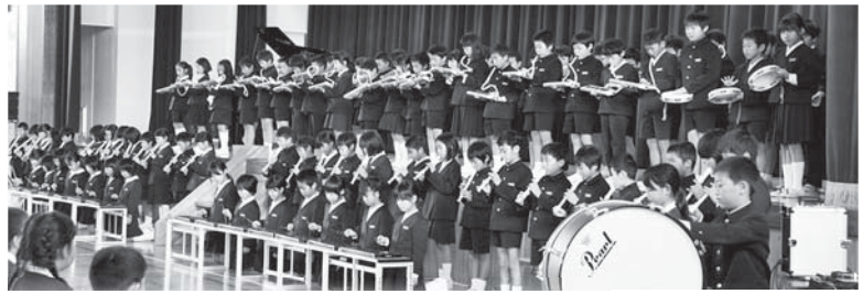
▲学年ごとに合唱や合奏、群読を発表しました

また、前文部科学大臣の衆議院議員・馳浩氏がしたためた「志高く」の校訓額除幕式も開かれました。（4）