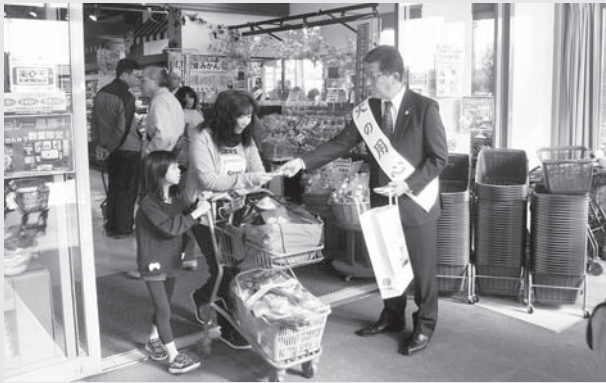
スーパーでチラシなどを配り、防火を呼びかけた

11月9日(水)から15日(火)まで全国一斉に「秋の火災予防運動」が展開され、その行事の一環として、13日(日)には、どんたく高浜店、スーパーセンターロッキー志賀の郷店、Aコープとぎ店、増穂浦ショッピングモール・アスクで、街頭防火宣伝を実施しました。当日は、防火チラシやティッシュを配布し、防火を呼びかけました。