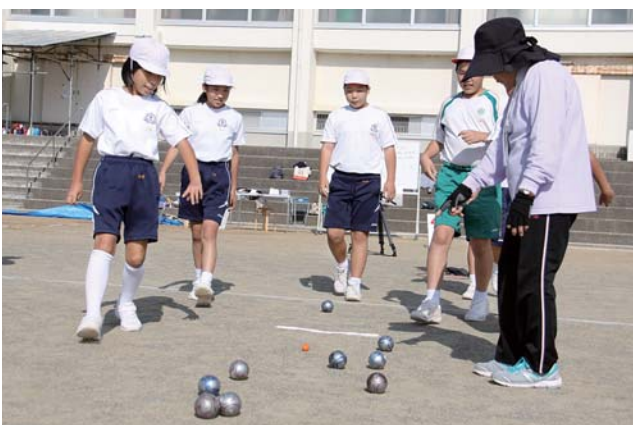
会員に得点の見方を教わる児童