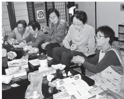
手芸に励む利用者の皆さん