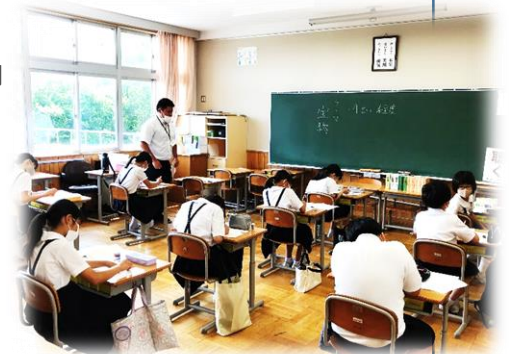
コンクール当日の様子