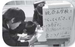
感謝の言葉を書く児童