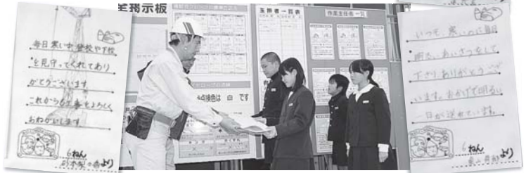
現場所長にメッセージを贈る児童代表