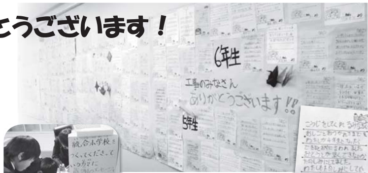
作業員休憩所の壁一面

1年生から6年生まで165人、一人一人のメッセージが現場所長に手渡され、作業員休憩所の壁一面に張られました。作業に携わる人たちは、「よく見ているね」と感嘆しきり。ひとときの休憩時間に、温かいメッセージが励みとなっています。