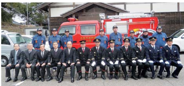
▲引渡し式(写真上)と入魂式(写真下)