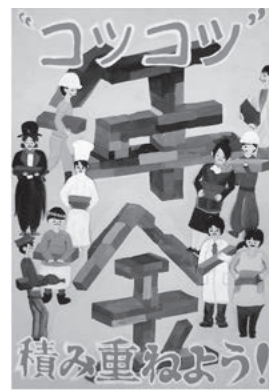
山形県年金ポスター コンクールより