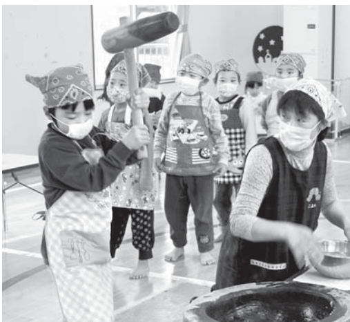
杵で順番に餅をつく園児たち