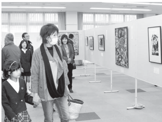
版画展示会場の志賀町文化ホール