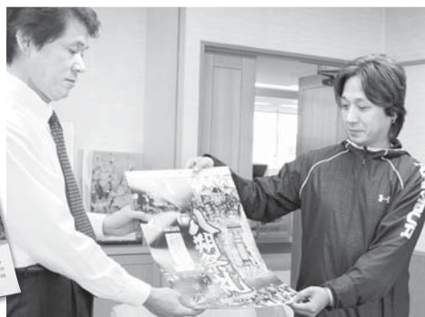
八朔祭礼のカレンダーを贈る八朔壮年会