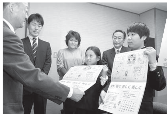
ふれあいカレンダーを贈る高浜小学校の皆さん