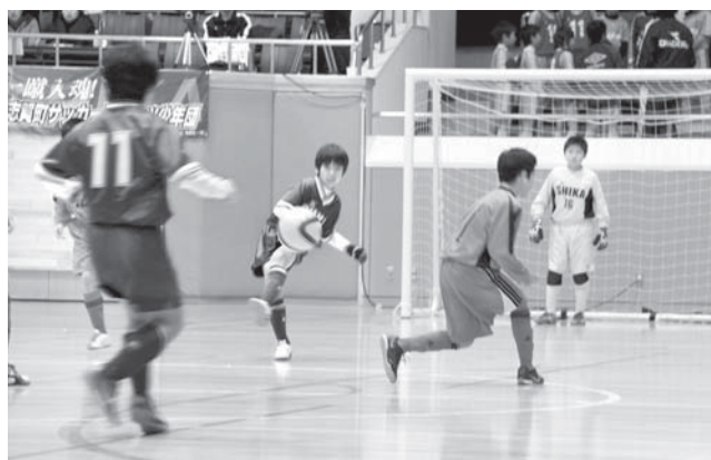
志賀町サッカースポーツ少年団Aの試合

最終日、全チーム保護者による「ころ柿争奪じゃんけん大会」も行われ、会場は最後まで大いに盛り上がりました。