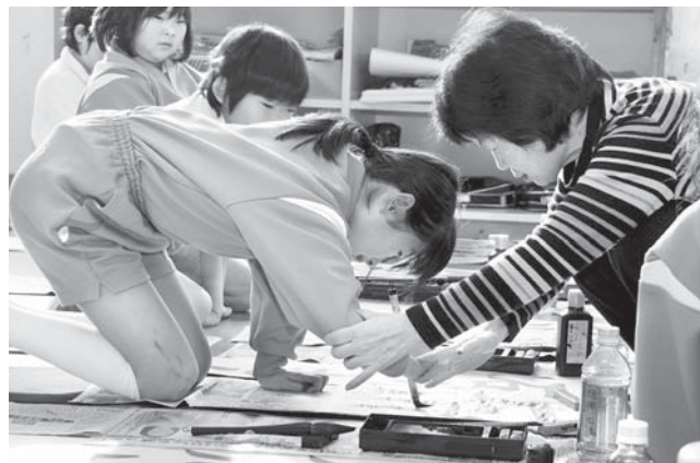
名山先生の指導を受ける3年生

分からないことがあれば積極的に質問し、次はもっと上手く書こうと意欲的に取り組んでいました。