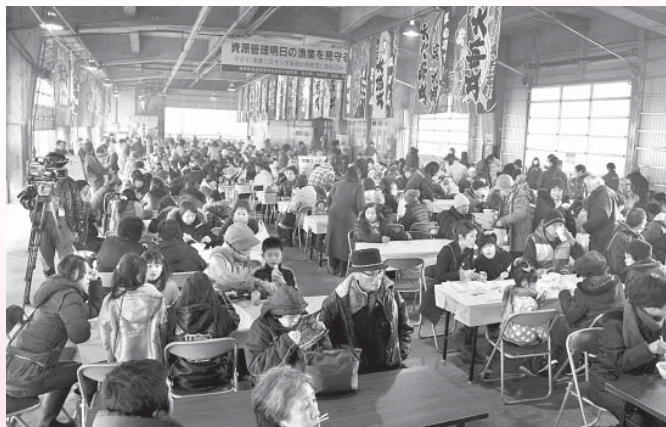
海の幸を味わおうと多くの人が詰め掛けた第1回大漁起舟祭