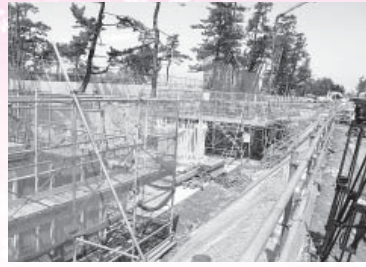
防潮堤の建設現場（H24.4撮影）

再稼働に関しては、破砕帯の調査や安全審査で安全性が確認されることが大前提であり、その上で町民の皆さまや町議会のご意見をお聞きし、慎重に判断していきます。