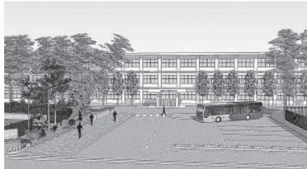
新富来中学校の完成予想図

これにより周辺の悪臭問題も解消され、生活環境の改善と市街地の良好な発展につながるものと考えています。