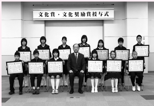
文化賞・文化奨励賞を受賞した皆さん