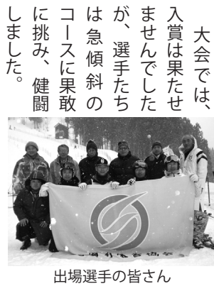
出場選手の皆さん