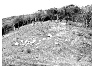
千浦二子塚古墳群