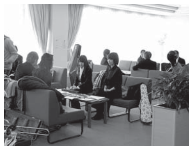
文化ホールでの撮影シーン 有村架純さん(中央左)と釈由美子さん(中央右)