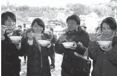
福浦港で炊き出しによる海鮮鍋を味わった

町の人たちは、みんなが家族のように、地元に対して、福浦漁港に対して誇りを持っていて、ふるさと愛や地域の絆を感じました。