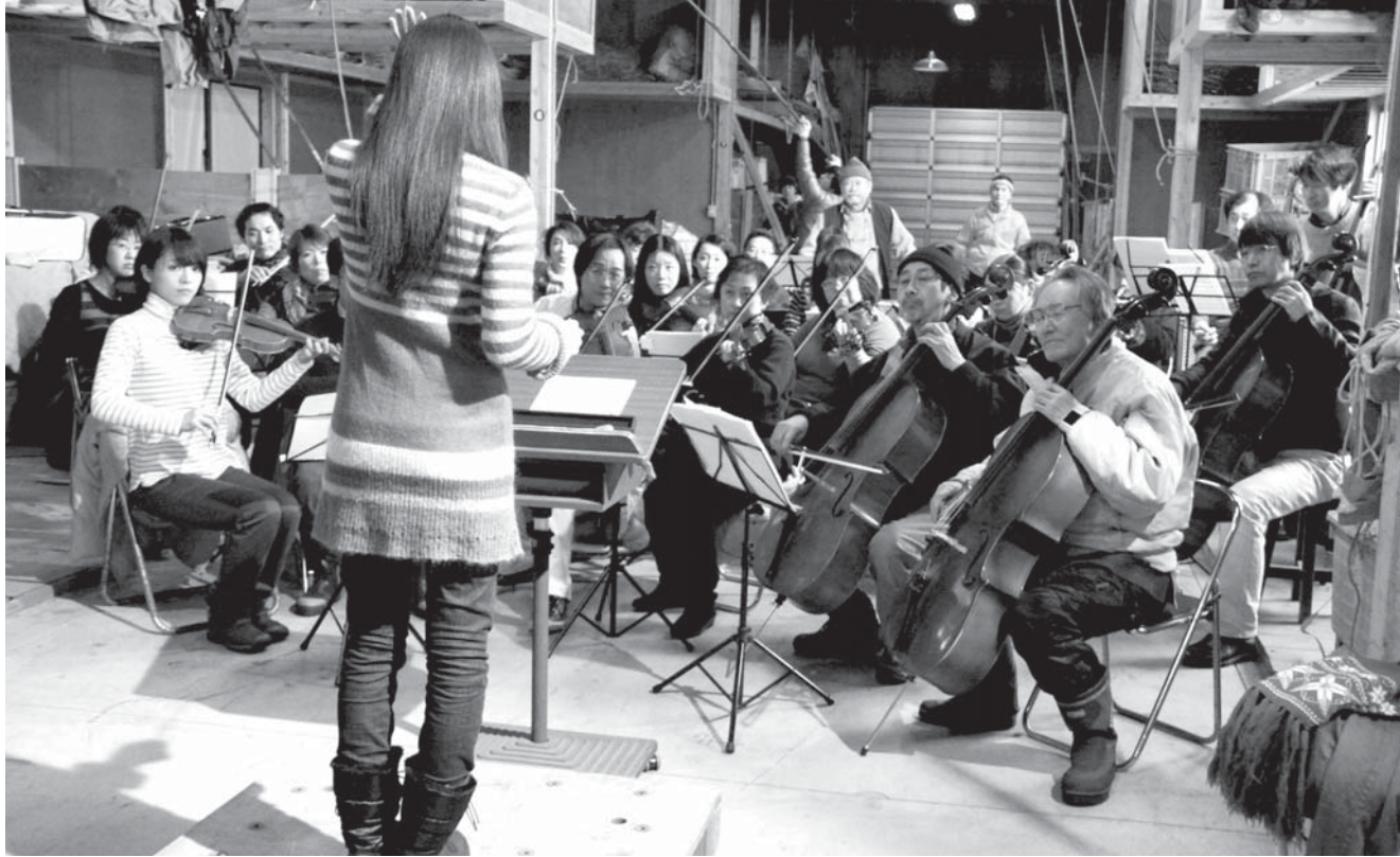
オーケストラの一員として出演したエキストラの皆さんと俳優陣。撮影は深夜にまで及んだ。(撮影場所：高浜漁港漁具倉庫内)