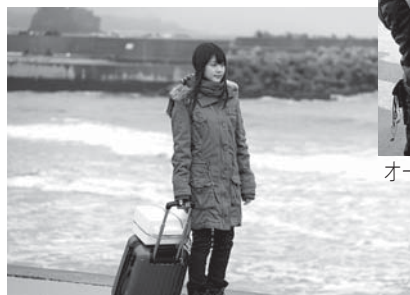
最後の撮影現場となった領家浜でのワンシーン