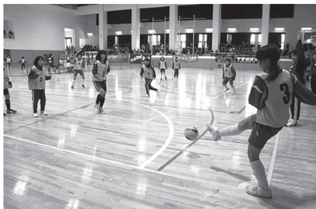
なでしこジャパンのような熱戦が繰り広げられました

試合を終えた児童は「シュートをしなくてもゴールになかなか入らなくて難しかった。練習した成果が少しでも発揮できたのがうれしかった」と話しました。