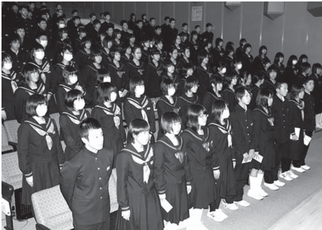
立志を迎えた志賀中、富来中の2年生