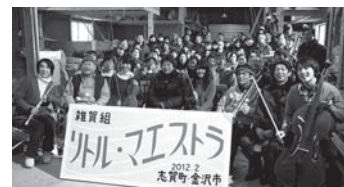
映画出演者、関係者の皆さんで記念撮影

「はい、オッケー」。鉛色の空に雪が吹き荒れる厳しい寒さの中、撮影現場では雑賀俊郎監督の声が響き渡った。町内から募ったエキストラの皆さんは、凍てつく寒さのなかでも楽しみながら撮影に臨んでいる姿があった。 今年の秋には全国ロードショーの予定で、その前に石川での先行上映を予定しているという。私たちの故郷が舞台となったご当地映画をこうご期待!!