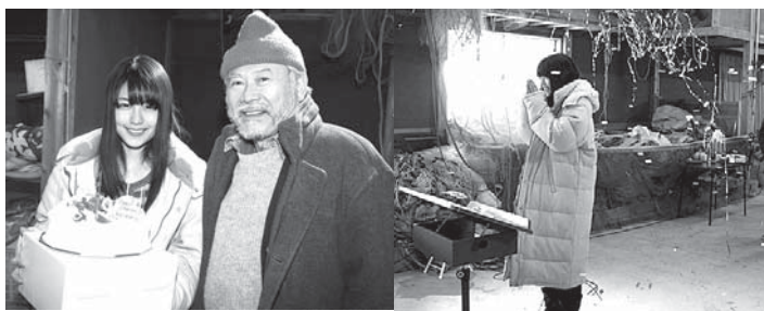
撮影終了後、関係者からのサプライズで2月13日が誕生日の有村架純さんと2月21日が誕生日の前田吟さんにケーキが渡された(左) 突然の祝福に驚く有村架純さん(右)