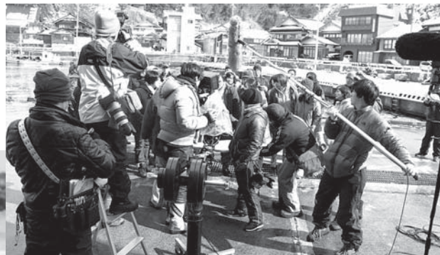
オーケストラのメンバーが 県漁協福浦港支所に詰めかけるシーンの撮影