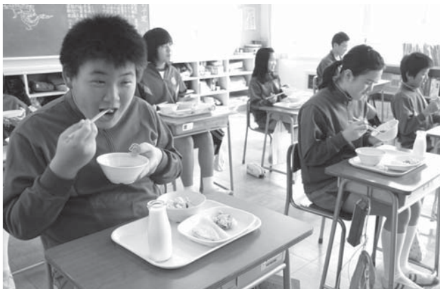
メギスのつみれ汁を味わう生徒