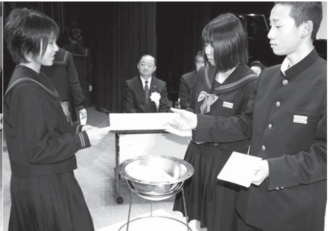
タイムカプセルに20歳の自分宛てへの手紙を入れる