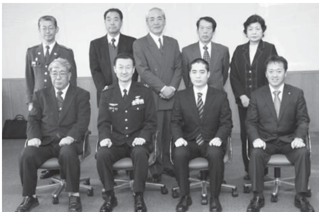
本谷さん(中央右)と激励会出席者の皆さん