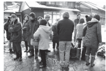
シーンを撮り終え、休憩中のエキストラ