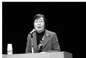
【登山家の田部井淳子さん】