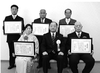
【功労者表彰受賞者の皆さん】