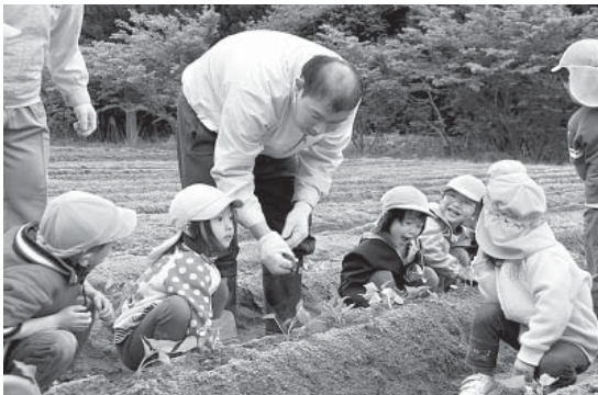
通所生に土のかぶせ方を教わる園児たち