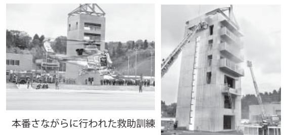
本番さながらに行われた救助訓練