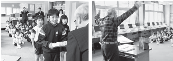
物品の交付を受ける児童代表