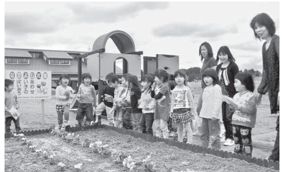
きれいなお花が咲くといいな