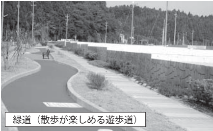
緑道（散歩が楽しめる遊歩道）