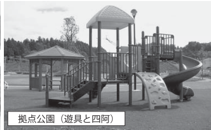
拠点公園（遊具と四阿）