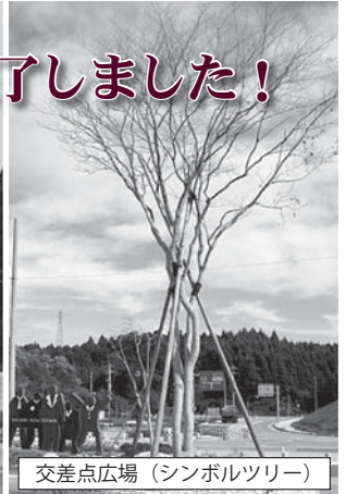
交差点広場（シンボルツリー）