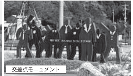
交差点モニュメント

昨年9月に予約受付した西山台ニュータウンの第1工区（55区画）の造成工事が完了しました。好評につき現在は、第2工区（34区画）の造成を行っていて平成22年1月末に工事も完了する予定です。