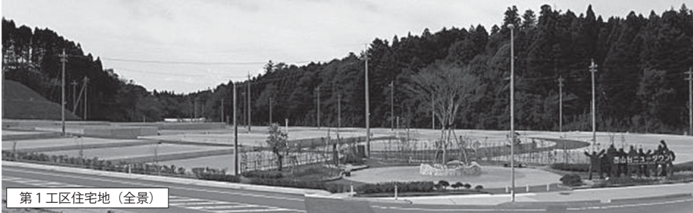
第1工区住宅地（全景）