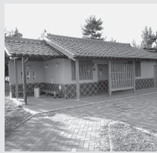
柴木総合公園整備（トイレ整備）