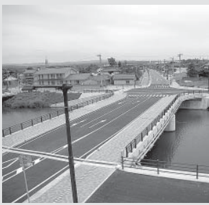
都市計画道路福野神代線整備

「まちづくり交付金」は地域の歴史や文化、自然環境などの特性を生かした個性あふれるまちづくりを実現し、地域の再生を効率的に推進することによって住民の生活の質の向上と地域経済・社会の活性化を図ることを目的として創設された期間限定の交付金です。