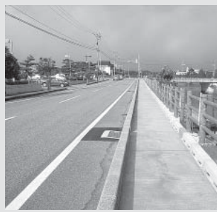
ウォーキングルート整備