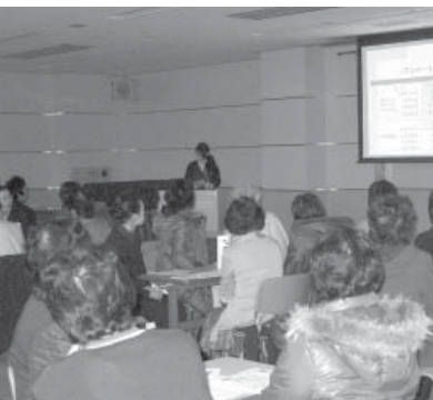
★☆☆簡単朝食レシピの紹介★☆☆

状況(幼児2%・小学生3%・中学生3%)を上回っています。近年では、朝食の欠食が及ぼす影響として、学習能力の低下、運動能力の低下などさまざまな事がわかってきています。また、全国的に見ても若い親世代の朝食欠食率が増加してきていることから、子どもの食習慣を見直すと同時に、大人も日頃の生活習慣を見直すことが必要になってきています。