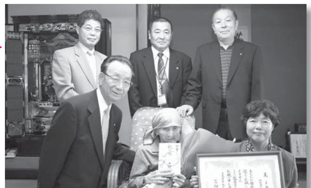
お元気で長生きしてください

美さんは少し耳が遠いものの、元気に生活しています。細川町長は「おめでとうございます。まだまだ長生きしてください」とお祝いの言葉を述べました。