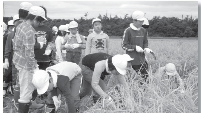
稲刈りを体験する高浜小の児童たち

この稲刈りは、社会科の授業の一環として行われているもので、刈り取られたもち米は11月の収穫祭で餅つきをして味わう予定です。