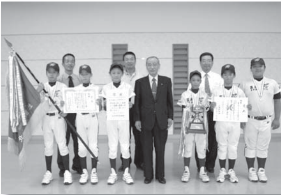
富来ますほ学童野球クラブの選手たち