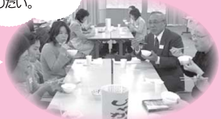
◇自分達で作った、ねんね団子のお味は？