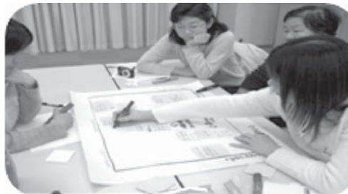
あなたの家の『自慢料理』は？!