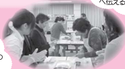
◇ねんね団子づくり体験