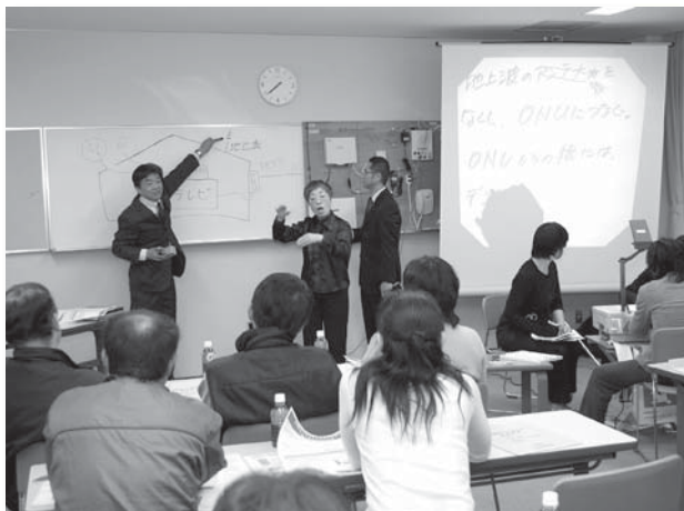
手話と要約筆記を使い説明するメンバーのみなさん

お問合せ先 ☎ 32-9261（情報推進課） ☎ 32-9999（SCN 志賀町ケーブルテレビ）